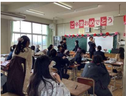
【卒業式後の学活の様子】