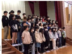
【卒業式練習の様子】

めたことを確信しました。卒業生のみならず！有馬小学校の先生たちはいつまでも、応援しています!!