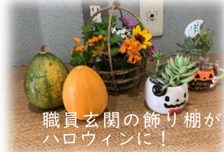
職員玄関の飾り棚がハロウィンに!

次の日の運動会に向けて、6年生と職員で準備をしました。必要なものを外に運び、入退場門等を設置しました。進んで働く6年生の姿は頼もしい限りでした!