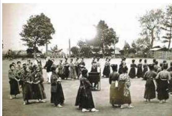
【大正4年卒業式の様子(有馬小学校)】

大正時代の運動会は、中部七校連合運動会(海老名、座間、大和、有馬、渋谷、御所見、綾瀬)でした。徒競走や遊戯、大玉送り、騎馬戦を裸足で行いました。応援歌があり、他校の校歌を覚えて帰って来ました。有馬は強い方ではなかったたので、優勝はしたことがありませんでした。学芸会は、武井先生のお宅でやられたそうです。