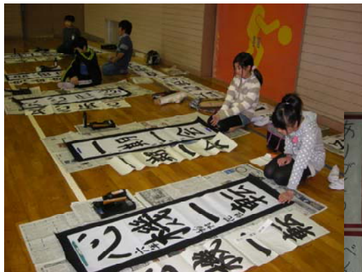
上手に書けたかな

さらに、この日の午前中、「サポータークラブ」の方々に【花壇の整備等】をしていただきました。こちらも、寒い外での活動でしたので大変ご苦労をおかけしました。本当にありがとうございました。