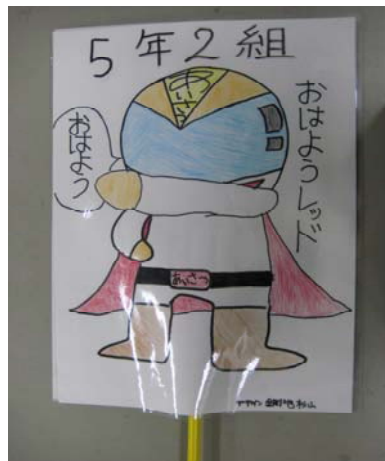
おはよう レッド! ただいま参上!