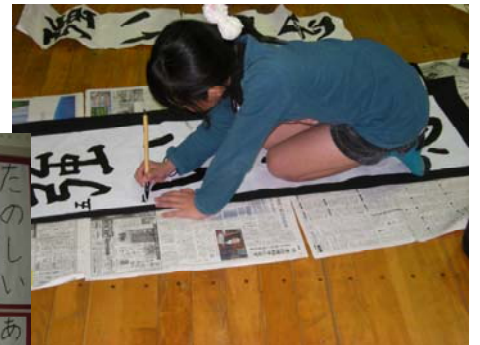
一筆一筆 心を込めて!