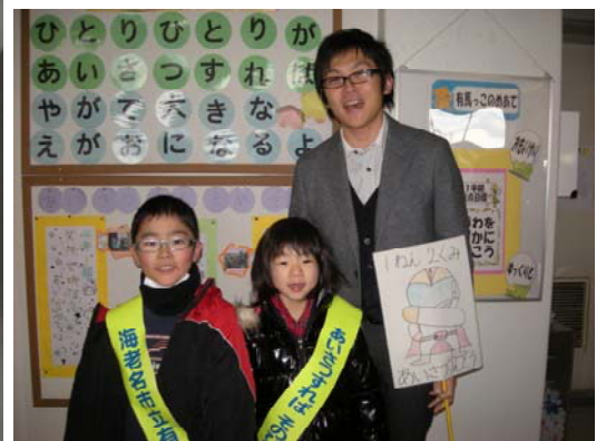
先生と一緒にニコニコ笑顔で あいさつ運動