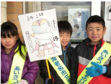
おはようレッドと一緒に 「おはよう」のかけ声!