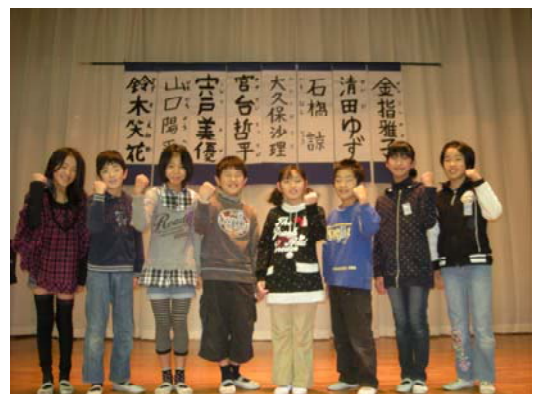
平成24年度の運営委員8名が決まりました。 笑顔いっぱい・挨拶いっぱいの有馬小 目指して頑張ります!