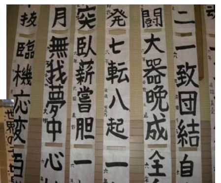
6年生は自分で選んだ 四字熟語に挑戦!